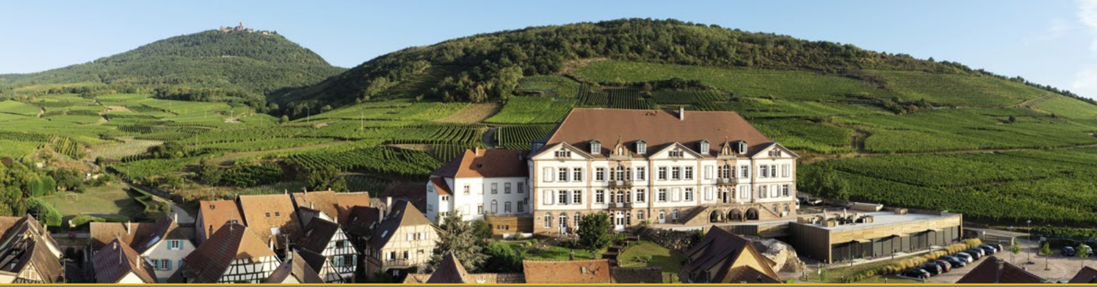
Débats à l'hôtel «Val-Vignes» Saint-Hippolyte • Samedi, 2 juillet 2016