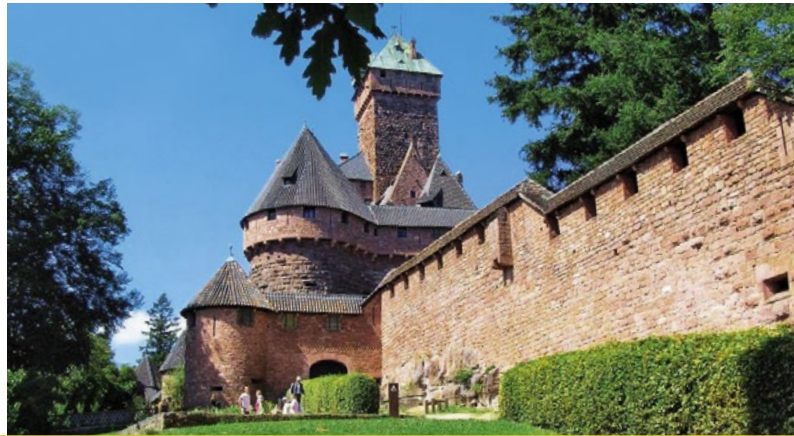
Dîner de Gala au château du «Haut-Koenigsbourg» • Samedi, 2 juillet 2016