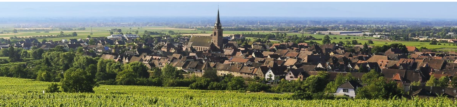
Challenge International des Clubs Œnophiles (CICO) à Bergheim • Dimanche, 3 juillet 2016